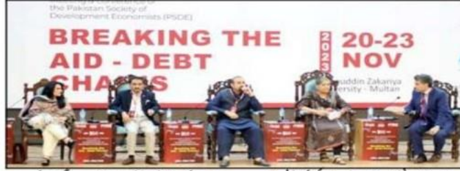
ملتان: پاکستان ائی ٹی آف ڈیپنٹ آف ایکس کی کانفرنس کے دوسرے روز بہاد الدین زکریا یونیورسٹی میں سینئر ریسرچ اکانومسٹ دیگر خطاب کر رہے ہیں