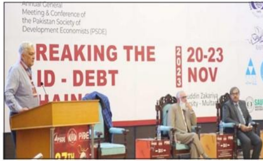
پابلیڈ کی سالانہ سینتیسوی کانفرنس

ملتان (سٹاف رپورٹر) اکیس نومبر پابلیڈ کی سالانہ سینتیسوی کانفرنس کا بہاول الدین یورٹی ملتان میں آغاز ہو گیا۔ یہ کانفرنس چار روز تک جاری رہے گی۔ بہاولدین زکریا یونیورسٹی ملتان کے باہمی اشتراک سے منعقدہ کانفرنس میں جنوبی پنجاب کے مختلف اضلاع کی یورٹیسٹیز کے اساتذہ، باقی صفحہ 7 تقریب نمبر 33