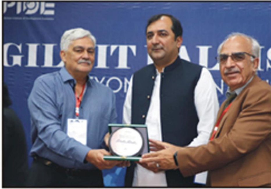
گلگت: وی سی کیو ڈیزبر اعلیٰ گلگت بلتستان کو سوئیر پیش کر رہے ہیں۔

روزنامہ ”صدائے گلگت“ گلگت بلتستان (4) جمعرات 18 مئی 2023