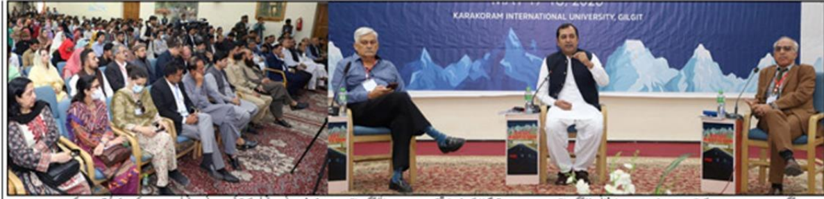
گلگت KIU اور PIDE کے تعاون سے منہندہ اور وزیر کا ٹرانس "گلگت بلتستان پہاڑوں سے آگے" کے افتتاحی تقریب سے وزیر اعلیٰ گلگت بلتستان خالد خورشید، وائس چانسلر کے آئی پاور اور اس چانسلر PIDE ڈاکٹر محمد امجدی خطاب کر رہے ہیں