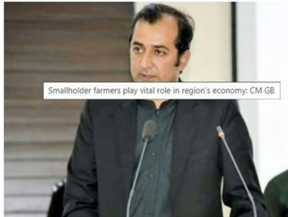
Smallholder farmers play vital role in region's economy: CM GB