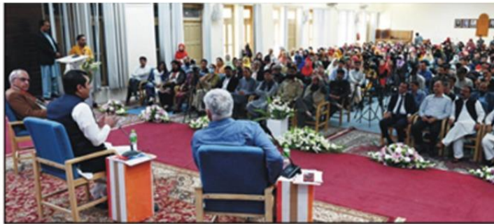
گلگت، وزیر اعلیٰ گلگت بلتستان خالد خورشید تقریب میں منہندہ، سیمینار کے موقع پر گفتگو کر رہے ہیں