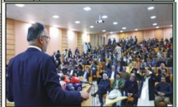
وفاقی وزیر منصوبہ بندی کانفرنس سے خطاب کر رہے ہیں