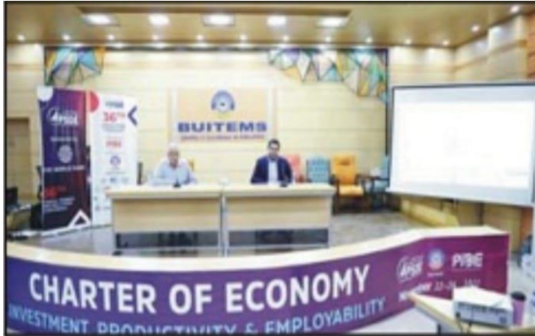
پانڈی کی سہ روزہ کانفرنس میں مقررین خطاب کر رہے ہیں

پانڈی کی سہ روزہ کانفرنس کا اختتام جیٹا معیشت کے مسودے پر سیر حاصل گفتگو کیساتھ ہوا۔ سز سال ہو گئے ہیں ہم معیشت کو سدھار نہیں سکے، کیونکہ اس پر کسی نے سنجیدگی سے بھی کام ہی نہیں کیا، وائس چانسلر پانڈی خطاب کرتے ہوئے وی سی پانڈی ڈاکٹر عظیم الحق، بلوچستان یونیورسٹی کے وائس چانسلر شاہد کاردار نے خطاب کرتے ہوئے کہا کہ اس وقت پاکستانی معیشت کے بارے میں نہ صرف بات چیت کرنے کی ضرورت ہے بلکہ اس پر بھرپور توجہ دینے کی ضرورت ہے تاکہ مستقبل کا پاکستان روشن اور تاناک ہو سکے۔ پانڈی کے وائس چانسلر نے اپنے اختتامیہ کلمات ادا کرتے ہوئے کہا کہ سز سال ہو گئے ہیں ہم معیشت کو سدھار نہیں سکے، کیونکہ اس پر کسی نے سنجیدگی سے بھی کام ہی نہیں کیا۔ اس لیے پاکستان انیشیٹیو آف ڈویلپمنٹ اکٹاس نے چار آف اکاؤنٹی جیٹا معیشت (قوم کے سامنے چیلن کیا۔ کوئٹہ (سٹاف رپورٹر) پانڈی کی سہ روزہ کانفرنس کا آج تیسرا اور آخری دن تھا۔ کانفرنس کا اختتام جیٹا معیشت کے مسودے پر سیر حاصل گفتگو کیساتھ ہوا۔ جو کہ پاکستان کے معاشی مسائل کی نہ صرف نشاندہی کرتا ہے بلکہ اس کے متبادل حل بھی پیش کرتا ہے۔ کانفرنس کو مختلف اداروں نے سپانسر کیا۔ جس میں ورلڈ بینک گروپ، سی بی سی، سیٹل آف ایٹمی لینس، فلپڈ رک ایمرٹ سٹنگ، آئی ایف اے ڈی، نیشنل پورٹی گریجیویشن پروگرام انیگرو، پی پی اے ایف، بینک آف پنجاب، پی ایم آئی سی، آئی ایل او، نیس پبلیک، سعودی پاک اسٹریٹجی اینڈ انیگرنیٹو سسٹم کمپنی اور یونیورسٹی آف بلوچستان کے نام شامل ہیں۔ مختلف میٹھر سے